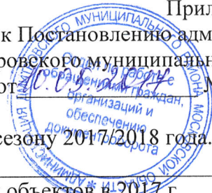
ГРАФИК подготовки и сдачи жилых домов к отопительному сезону 2017/2018 года.